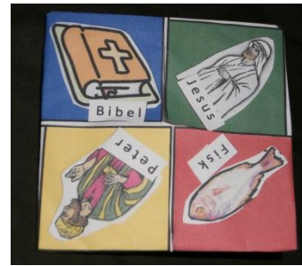
Ex:” Jesus og Peter”

Gå ind på www.gratisskole.dk og ud print en tom flip flap / lav den selv. Find billeder der hører til Bibelfortællingen (Word multimedieklip kan bruges) og lim dem på forsiden i de fire felter( når flip-flappen er foldet)