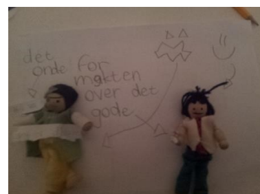
...og kvalte det.