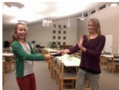
....og fuglene kom og åd det.