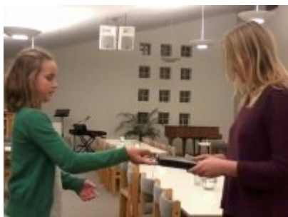
Noget faldt på vejen.....