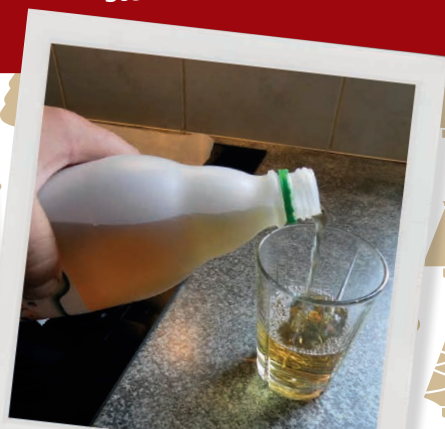
HÆLD EDDIKEN I ET GLAS.