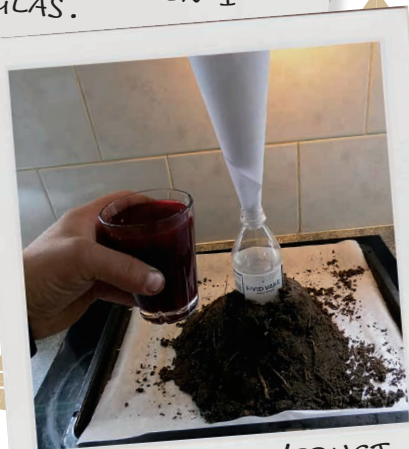
HÆLD EDDIKE/FRUGTFARVE I FLASKEN.