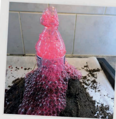
SÅ ER DER VULKAN-UDBRUD!