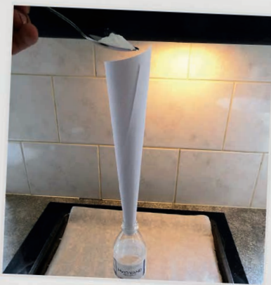
PUT NATRON I FLASKEN.