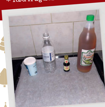
HER ER DET, DU SKAL BRUGE.