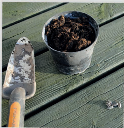
HER ER, HVAD DU SKAL BRUGE.