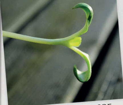
NÅR SPIRERNE ER STORE, KAN DU PLANTE DEM UD I HAVEN.