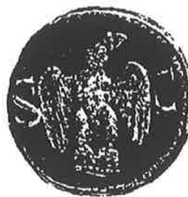
Romersk sølv mønt fra år 14-37 e.Kr. En mønt som altså var i omløb på den tid Judas modtog sin betaling for Jesus på 30 sølvpenge.

Læs beretningen i Matt.26,47-56 om Judas' forræderi og bed bagefter børnene om at tegne en tegning af det. Læs så teksten langsomt op igen og lad børnene lægge deres tegninger ned på gulvet efterhånden som beretningen kommer til det, som de har tegnet. Børnene lægger ofte mærke til forskellige ting i beretningen og det kan være fint at få en snak bagefter om hvorfor de lige har valgt at tegne dét eller dét. På den måde tvinges børnene også til at tænke over hvad ordene i teksten betyder.