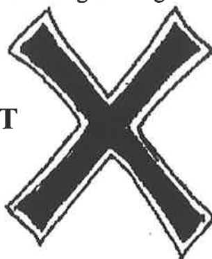
Illustration af pointen