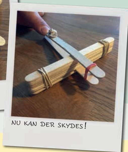
NU KAN DER SKYDES!