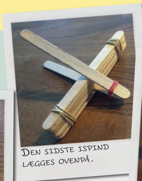
DEN SIDSTE ISPIND LÆGGES OVENPÅ.