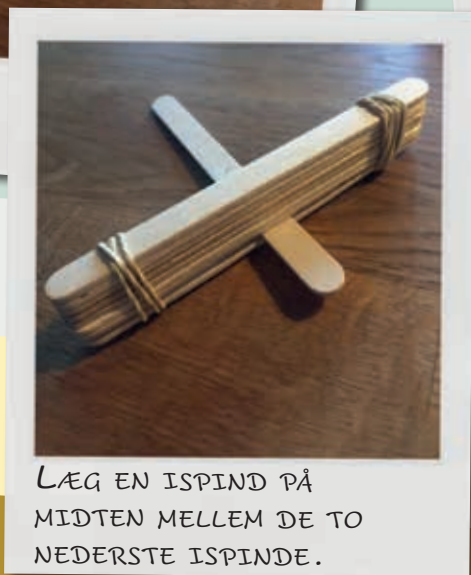
LÆG EN ISPIND PÅ MIDTEN MELLEM DE TO NEDERSTE ISPINDE.