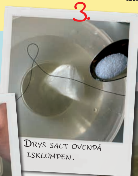
3. DRYS SALT OVENPÅ ISKLUMPEN.