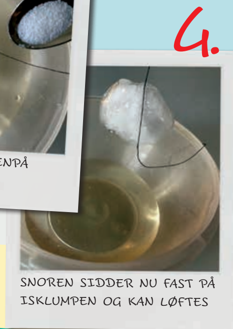
4. SNOREN SIDDER NU FAST PÅ ISKLUMPEN OG KAN LØFTES