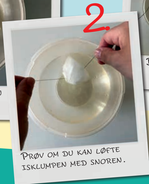
2. PRØV OM DU KAN LØFTE ISKLUMPEN MED SNOREN.