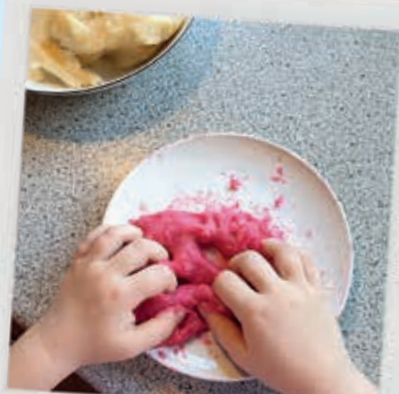
Så kan du gå i gang med at lege.