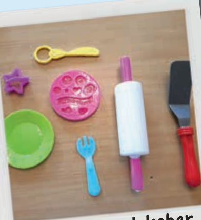
Find nogle redskaber, du kan bruge.