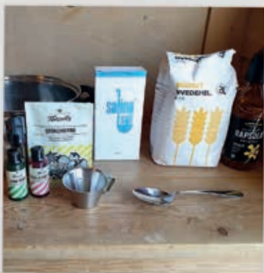
Det du skal bruge.