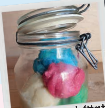
Put dejen i en lufttæt beholder.