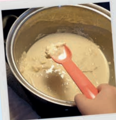
Kog vand og olie og lad det køle af.