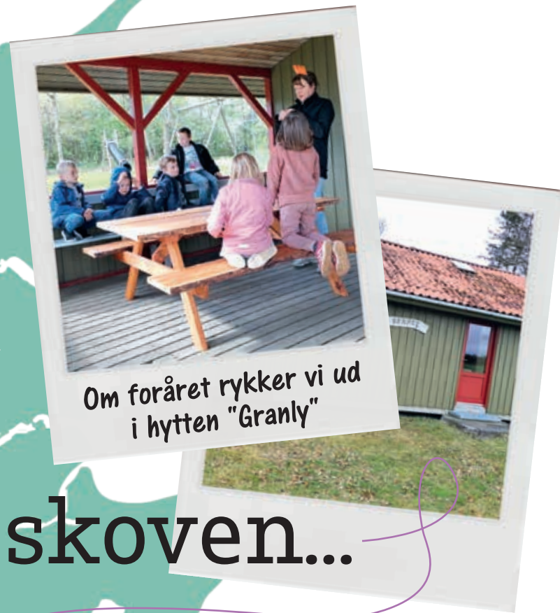
Om foråret rykker vi ud i hytten "Granly"

Kom frit frem! Skriv til os, hvis du har en vits eller en god ide, en bog eller en hjemmeside, du kan li', et favorithibelvers, en spændende oplevelse, en kreativ ide eller en opskrift. Send det til Komfrit, Møllegården 108, 5250 Odense SV eller til komfrit@lmbu.dk.